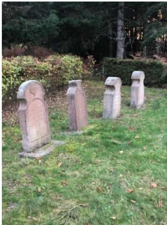
Pierres du cimetière mennonite

P.s: la visite de ce hameau dont une maison de mennonite peut se faire pendant la journée du patrimoine, en Septembre.