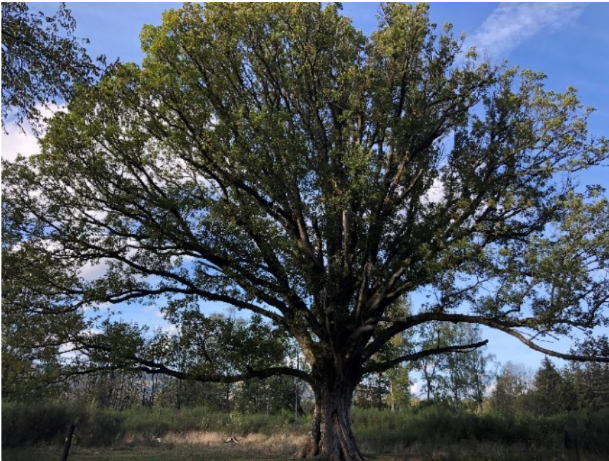
Le Gros Chêne

Le premier à l'origine de la dispense du service militaire armé auprès des conventionnels, d'où ce chêne planté symbole de leur droit à l'objection de conscience qui daterait de 1793.