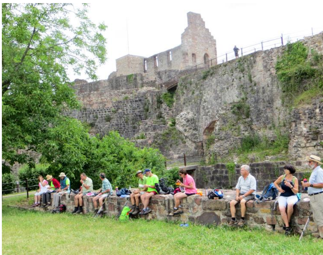
Randonnée du 25 juin avec le Schwarzwald Verein