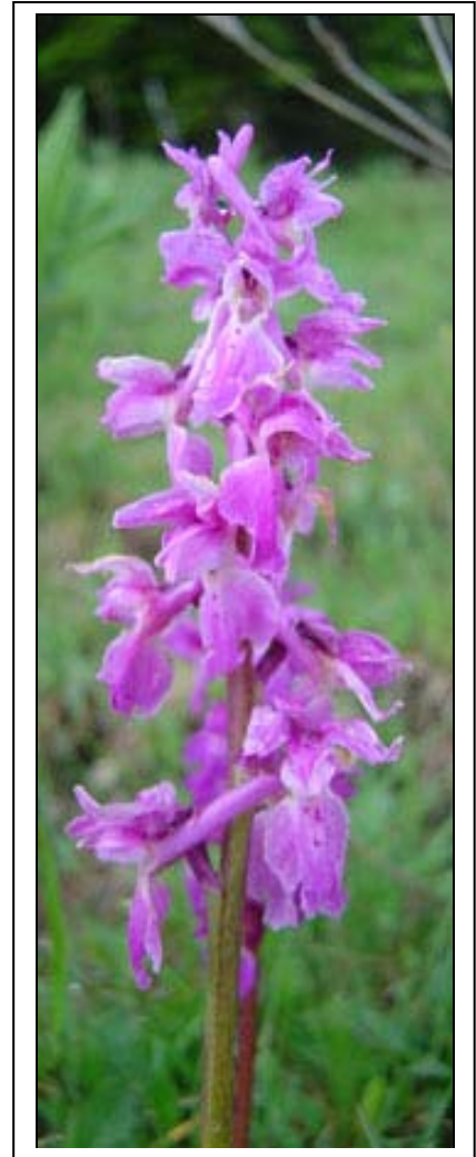
Orchidée Raimeux 2004