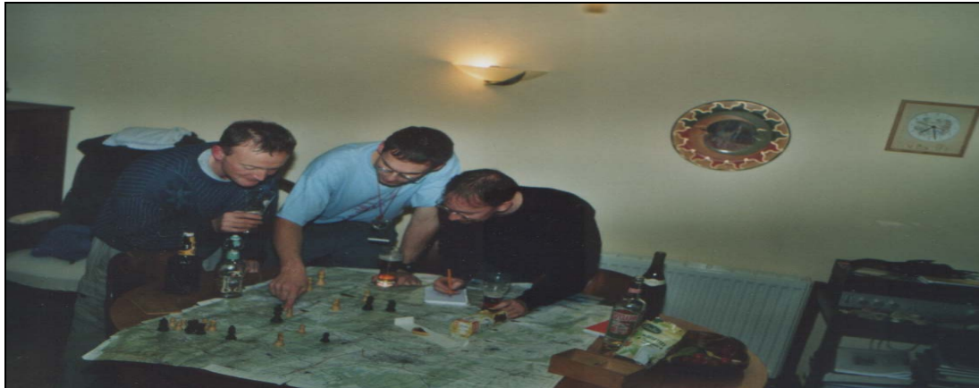
préparation itinéraire du trophée 2004