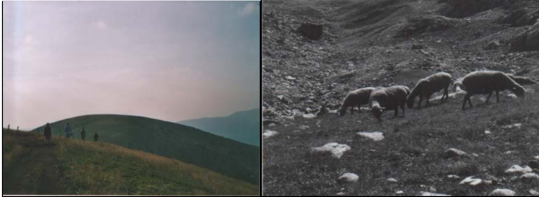
Vosges juin 2003