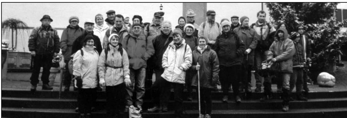
1° sortie 2003 à Bahlingen