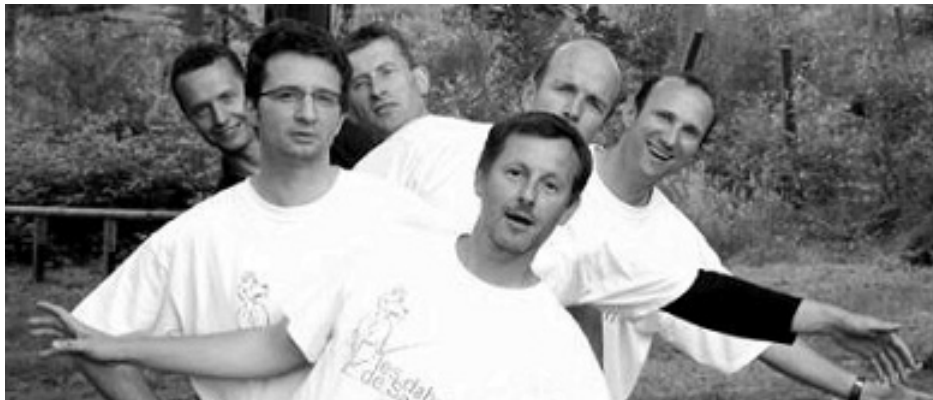
LES DAHUS DE SAVERNE