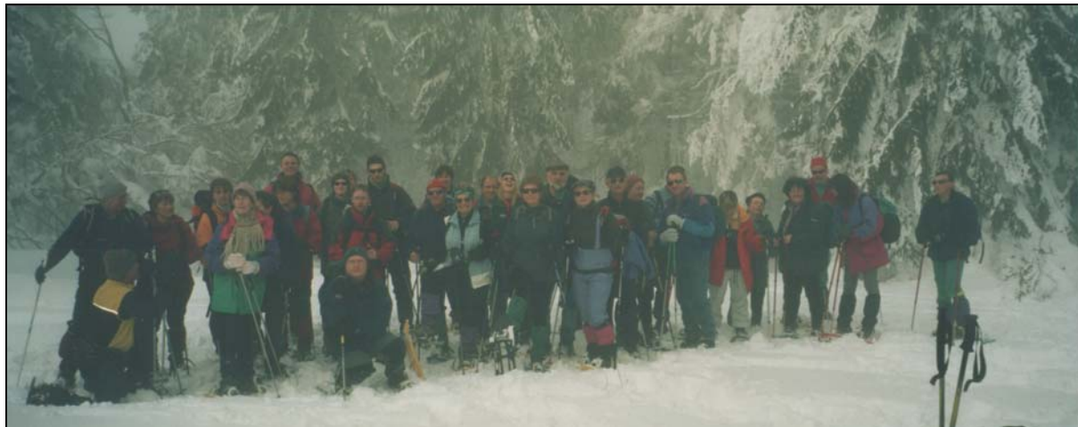
Sortie raquettes 9 février 2003.